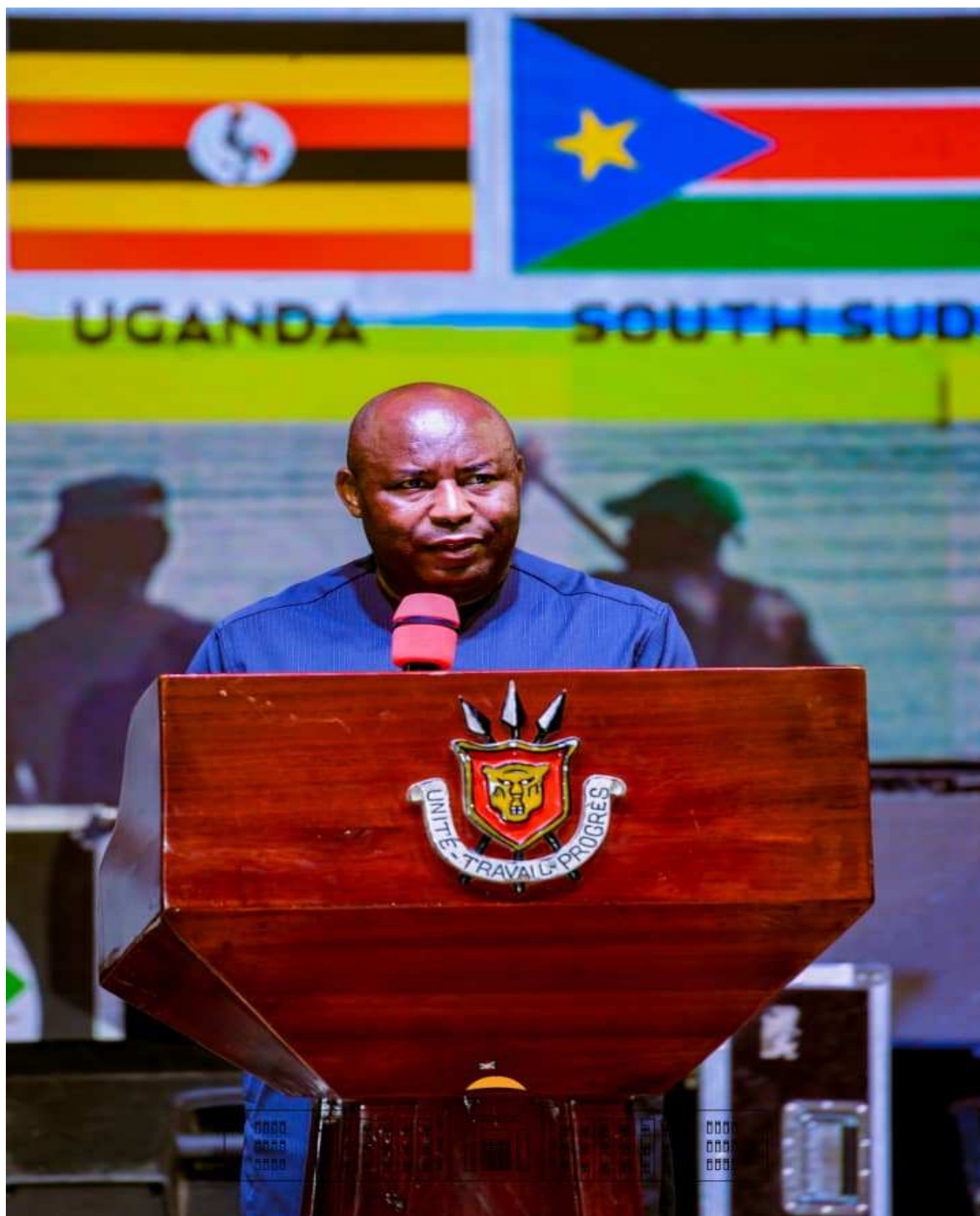
Le Chef de l'Etat Burundais et Président en exercice de l'EAC lance la 5ème Édition du Jamafest