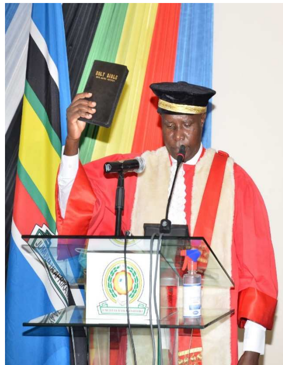
Prestation de Serment du Président de la Cour de Justice de l'EAC (EACJ)